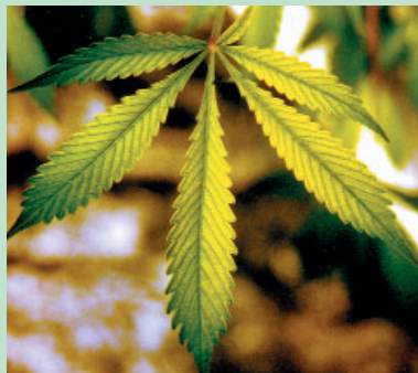
Vergeling van binnen naar buiten, de bladverven blijven meestal groen