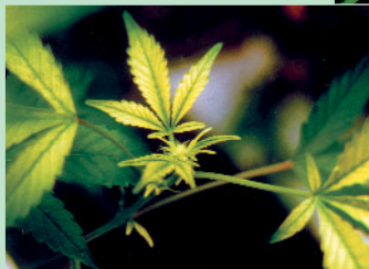
Gele tot soms bijna witte verkleuring van de groeischeuten