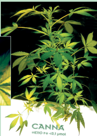
Groengele chlorose in de jonge bladeren en groeischeuten

- Organische mest zoals stalmest, kippenmest en champignoncompost toegevoegd aan de bodem verrijken de aarde met natuurlijke chelaten.